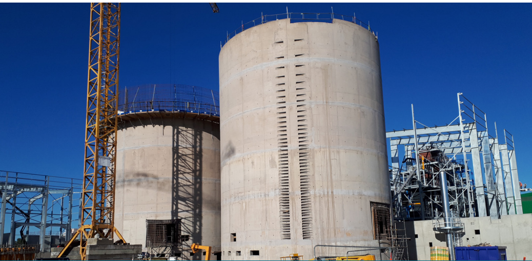
La future UTVD (usine de tri et valorisation des déchets) sera la première en France à disposer de plusieurs équipements de valorisation : trois digesteurs et une chaudière CSR.

Les collectivités et opérateurs du déchet sont ainsi contraints d'investir pour adapter leur mode de gestion des déchets et leurs équipements aux nouvelles exigences de la loi.