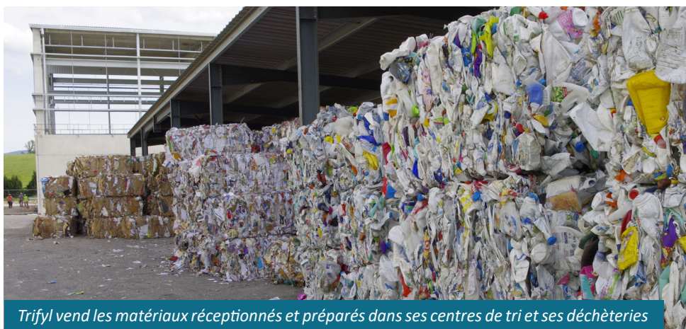
Trifyl vend les matériaux réceptionnés et préparés dans ses centres de tri et ses déchèteries pour financer une partie des dépenses liées à la gestion de nos déchets.

Le principe de tarification incitative appliquée aux collectivités adhérentes (selon la quantité et la qualité du tri) reste au centre du dispositif et permet de valoriser les efforts de réduction des déchets et de tri.