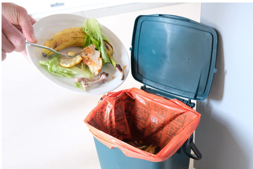
Le tri en sac des biodéchets : une solution complémentaire au compostage

Le biogaz est purifié, puis injecté dans le réseau de gaz et le compost est utilisé par la filière agricole. ■